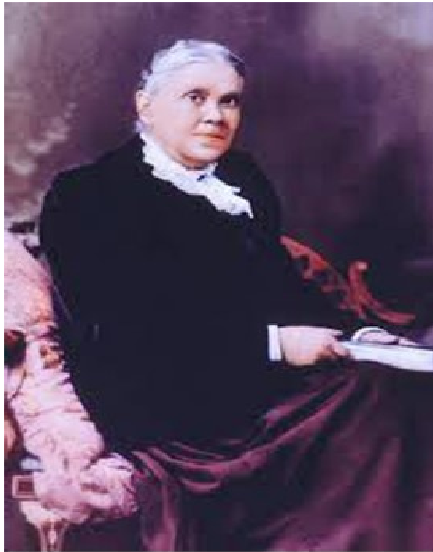
မစ္စင်အယ်လင်ဂျီဂိုက်